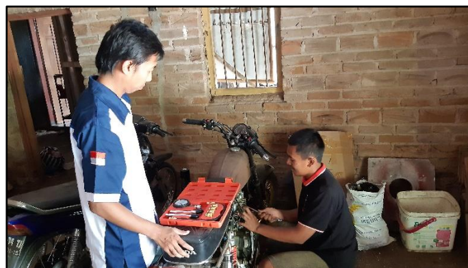
Gambar 3. Peserta menyiapkan sepeda motor untuk pengujian rasio kompresi