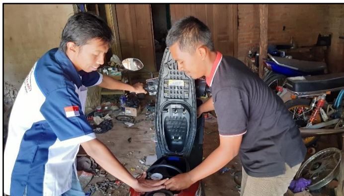
Gambar 6. Instruktur menunjukkan cara membaca hasil pengukuran tekanan pada fuel pump