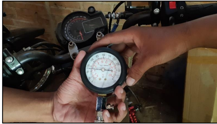
Gambar 4. instruktur mempraktikan penggunaan alat dan pembacaan hasil pengukuran rasio kompresi