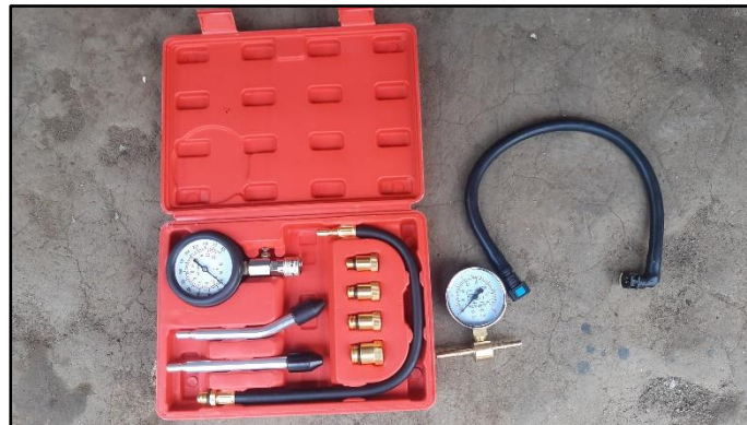
Gambar 2. Alat uji rasio kompresi dan tekanan pada fuel pump

Progam pengabdian kepada masyarakat berupa pelatihan penggunaan compression dan fuel tester dilaksanakan pada tanggal 4 Oktober 2022 bertempat di bengkel sabar garage. Jumlah peserta yang berpartisipasi dalam pelatihan sebanyak 1 orang. Tahapan pelatihan yang telah dilaksanakan anatar lain sebagai berikut: (1) Instruktur memaparkan materi tentang teori praktis tentang rasio kompresi dan sistem bahan bakar pada sepeda motor berteknologi EFI; (2) Instruktur melakukan praktik bersama-sama dengan peserta untuk menggunakan alat compression dan fuel tester ; dan (3) Instruktur menyerahkan bantuan berupa compression dan fuel tester kepada bengkel sabar garage. Adapun tahapan hasil pelaksanaan pelatihan ditunjukkan pada Gambar 2-7.