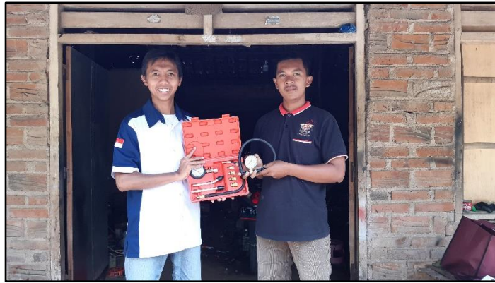
Gambar 7. Instruktur menyerahkan barang berupa compression tester dan alau uji tekanan fuel pump