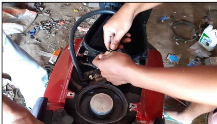
Gambar 5. Peserta mempraktekkan cara memasang fuel tester pada sepeda motor berteknologi EFI