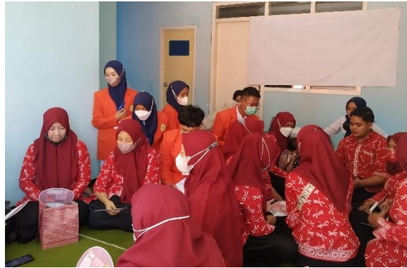
Gambar 5. Mahasiswa menilai proses role play