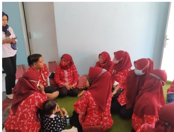
Gambar 4. Kegiatan Role Play

Para mitra atau kader, akhirnya, dibagi menjadi dua kelompok kecil untuk praktek public speaking dengan tujuan promosi kesehatan. Yang direncanakan oleh tim pengabdian akan ada lebih dari satu kader di masing-masing kelompok yang akan praktek penyuluhan, sayangnya hanya satu kader dari masing-masing kelompok yang praktek.