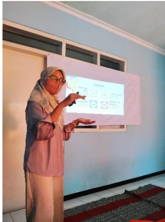
Gambar 3. Pemateri Pelatihan Public Speaking

Para mitra atau kader, akhirnya, dibagi menjadi dua kelompok kecil untuk praktek public speaking dengan tujuan promosi kesehatan. Yang direncanakan oleh tim pengabdian akan ada lebih dari satu kader di masing-masing kelompok yang akan praktek penyuluhan, sayangnya hanya satu kader dari masing-masing kelompok yang praktek.