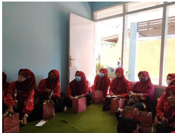
Gambar 2. Para Kader Hadir sebagai Peserta Pelatihan

Materi yang disampaikan berupa Public Speaking bagi Kader yang mana menyatukan ilmu public speaking dengan promosi kesehatan. Rujukan untuk public speaking yang digunakan berasal dari beberapa sumber mengenai public speaking dan buku panduan promosi kesehatan dari Kementerian Kesehatan Republik Indonesia.